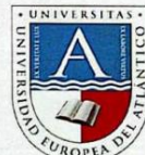
Rubén Calderón Iglesias